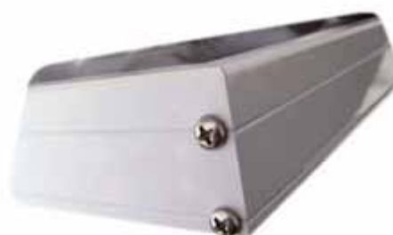
Окрашенная алюминиевая рама