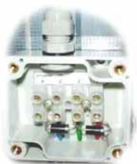
Сечение провода до 4 мм 2